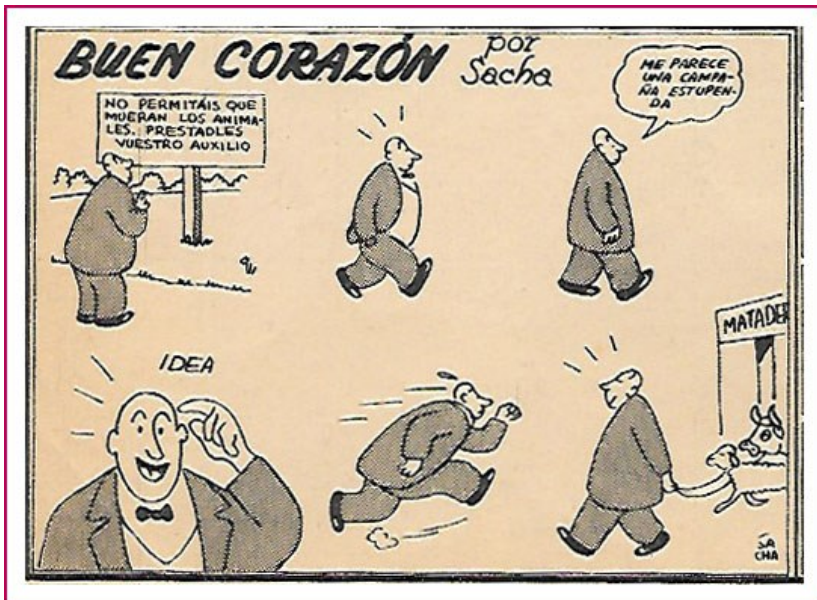
"Sacha" publicó esta historieta en el "Almanaque Humorístico de TBO" para 1956. En venta, diciembre de 1955. Ver que no ha puesto el sello "internacional" por que hay textos. Otro estilo gráfico de Blascafort