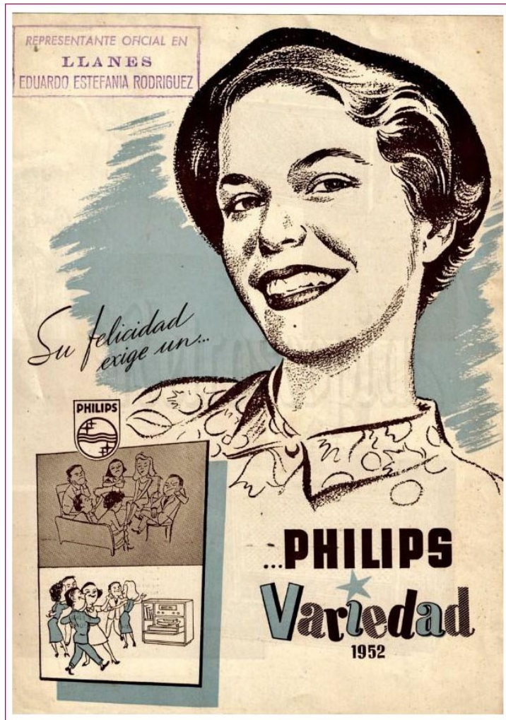
Dibujo publicitario de Philips de 1952, atribuido a Joan Blancafort